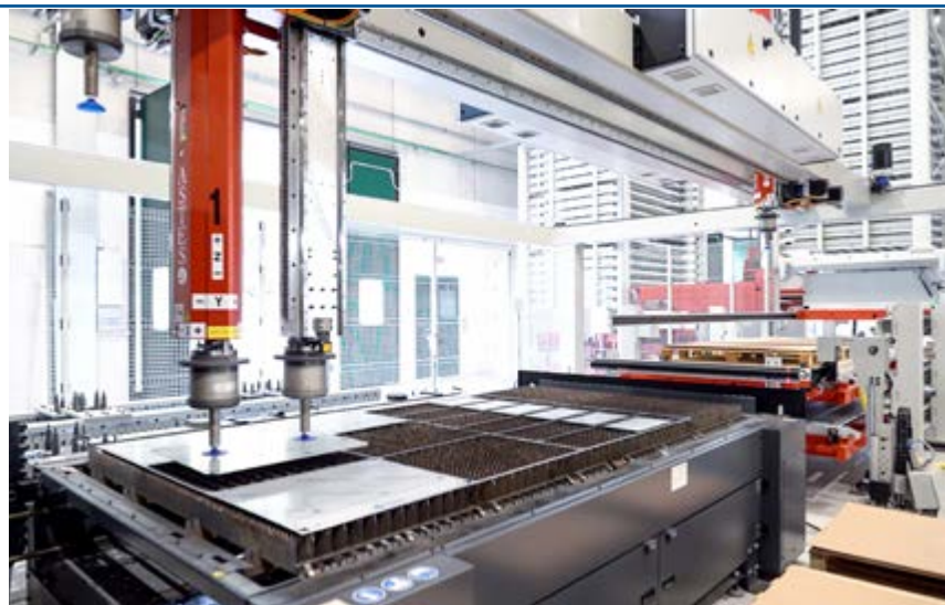
Dettaglio fase di presa pezzo effettuato in CBS con sistema di sorting di Astes4, per successiva pallettizzazione